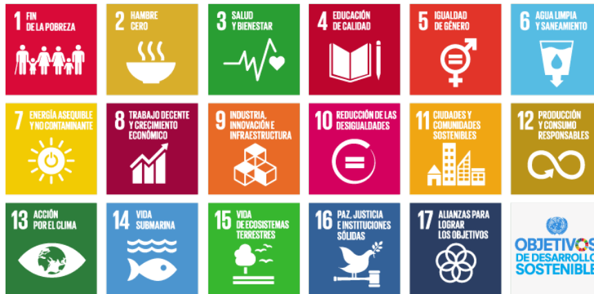
Figura 1. Representación gráfica de los ODS

La Tabla 5 presenta algunas de las relaciones que pueden identificarse entre el sector transporte y los ODS, mostrando tanto el ODS respectivo, su objetivo y los indicadores. Se ha realizado una correlación entre los atributos de sostenibilidad del sector transporte y los ODS. Esta tabla ha sido preparada tomando en cuenta la publicación denominada Marco de Indicadores Mundiales para los Objetivos de Desarrollo Sostenible y Metas de la Agenda 2030 para el Desarrollo Sostenible 11 .