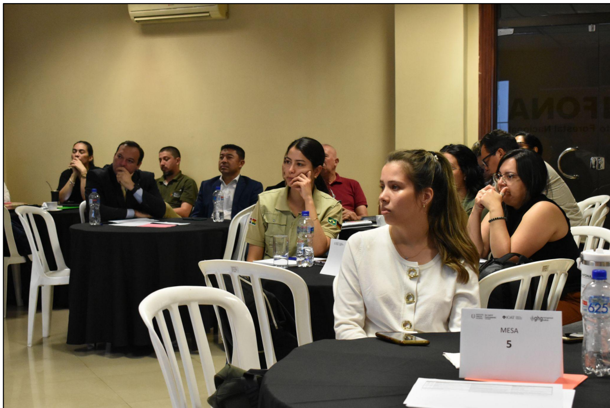
Figura 5. Participantes del taller de formación