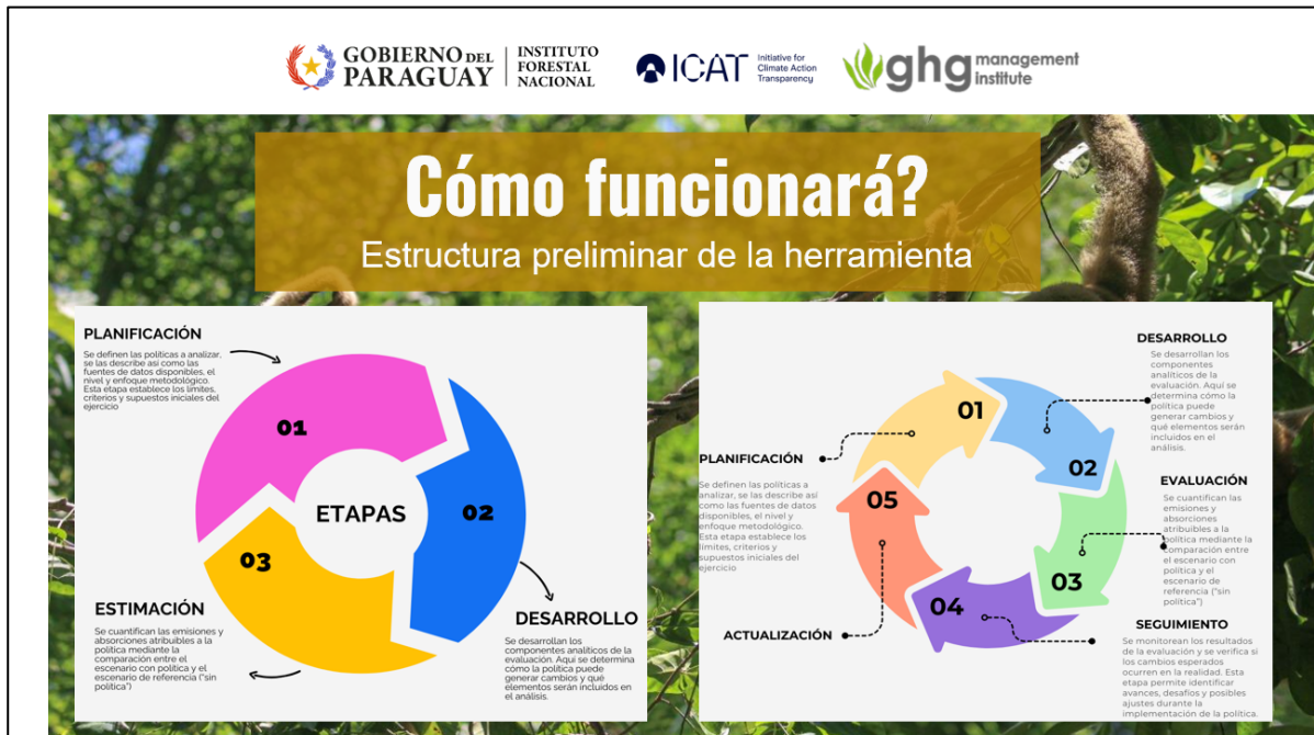
Figura 3. Esquema de presentación preliminar de la herramienta de evaluación

La jornada incluyó la exposición de los enfoques técnicos que sustentan el diseño de la herramienta, su articulación con el sistema de monitoreo forestal nacional y su potencial para apoyar procesos de evaluación de políticas. Estas presentaciones fueron acompañadas de un intercambio técnico entre las instituciones participantes, lo que permitió identificar prioridades, clarificar requerimientos operativos y recoger observaciones que servirán para el ajuste y mejora del diseño preliminar.